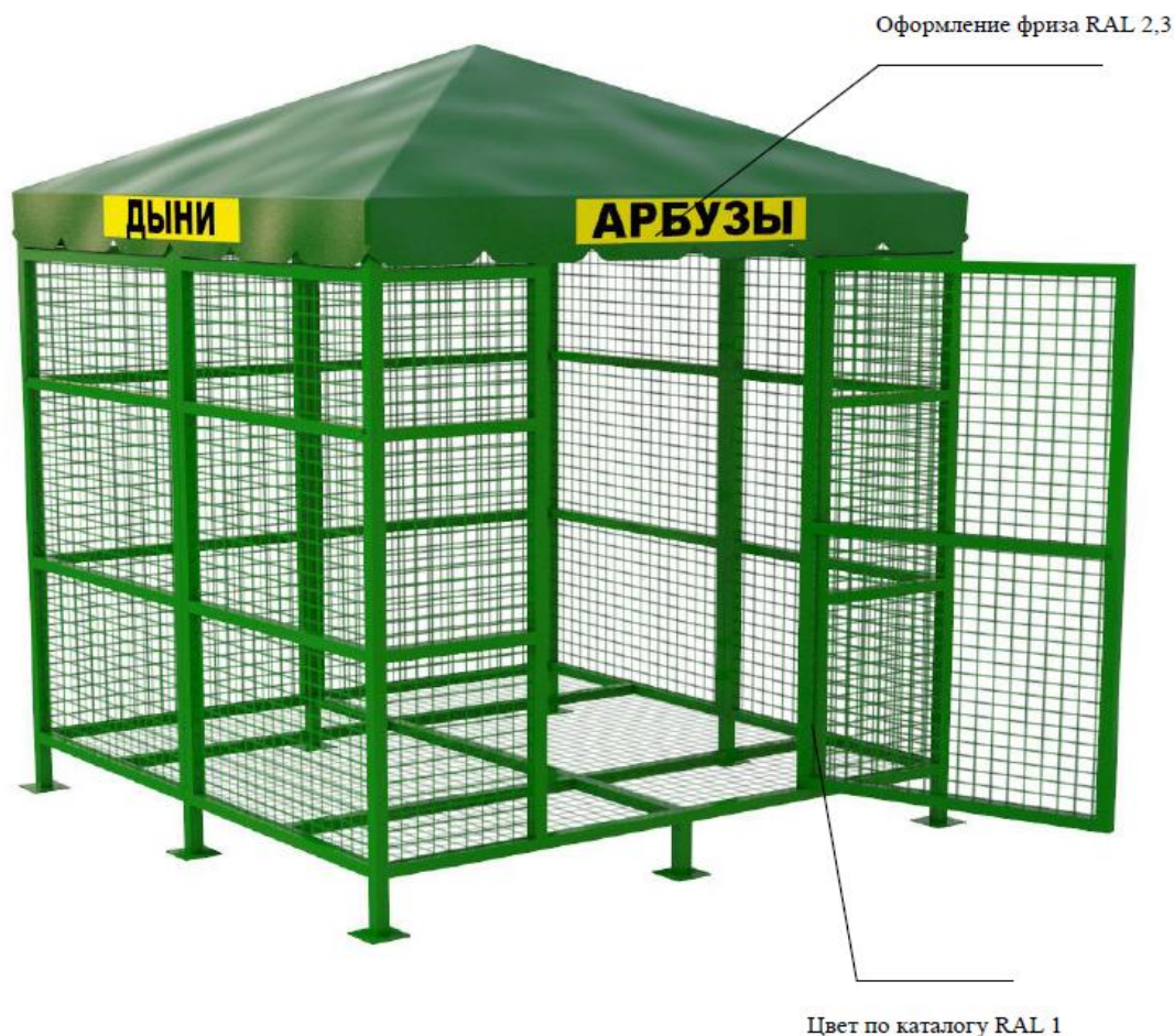
Рисунок 1 (1 секция)